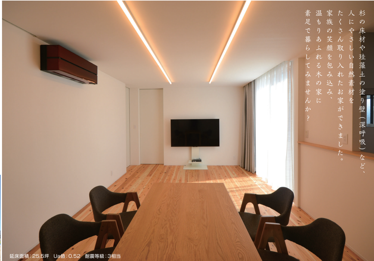
延床面積：25.5坪 Ua値：0.52 耐震等級：3相当

杉の床材や珪藻土の塗り壁(深呼吸)など、人にやさしい自然素材をたくさん取り入れたお家ができました。家族の笑顔を包み込み、温もりあふれる木の家に素足で暮らしてみませんか？